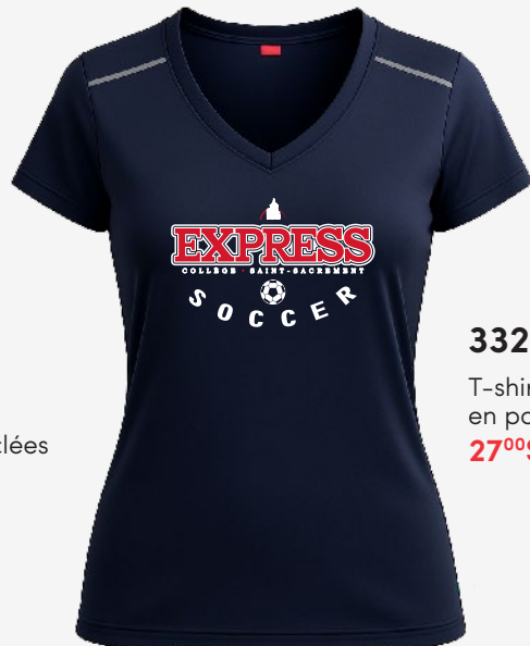
3325 T-shirt jersey en polyester 27 00 $