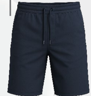
6130 Bermuda taille élastique en toile

(1 er avril au 31 octobre) Ne peut être porté ni trop court, ni trop serré