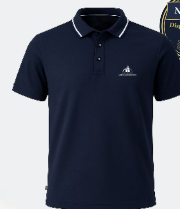
3186 Polo en polyester de fibres recyclées

(1 er avril au 31 octobre) Ne peut être porté ni trop court, ni trop serré