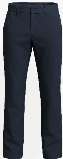
2107 Pantalon de ville tissé