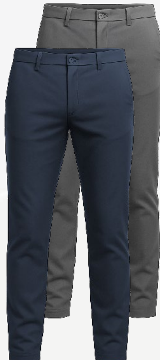
2118 Pantalon classique en toile