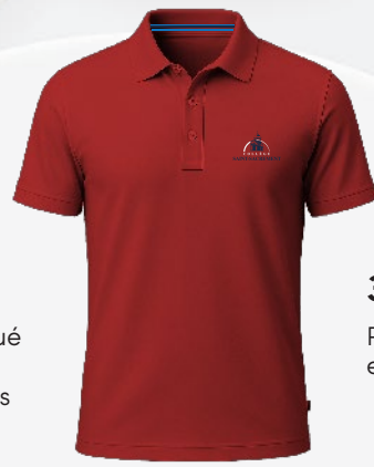
3116T Polo en coton piqué