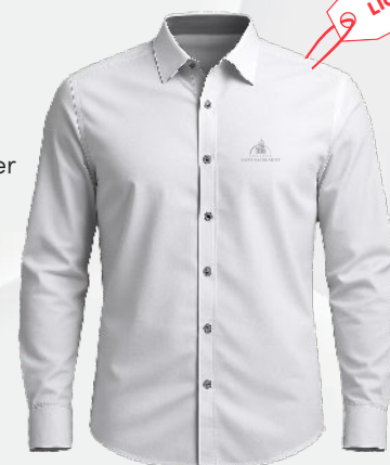
4510 Chemise en popeline