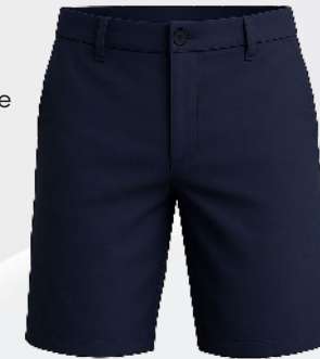
6131B Bermuda de ville en coton