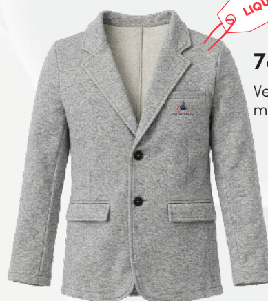
7812 Veston en molleton léger