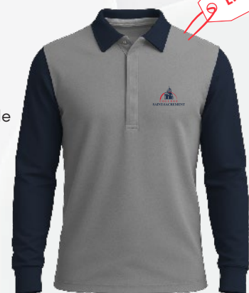
3152 Polo coton extensible