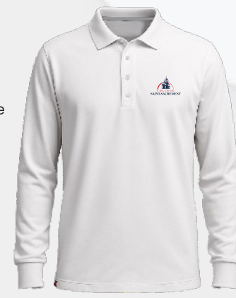
3117T Polo en coton piqué