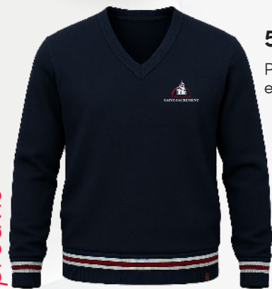
5414 Pull col en V en tricot

Les prix sont sujets à changement sans préavis