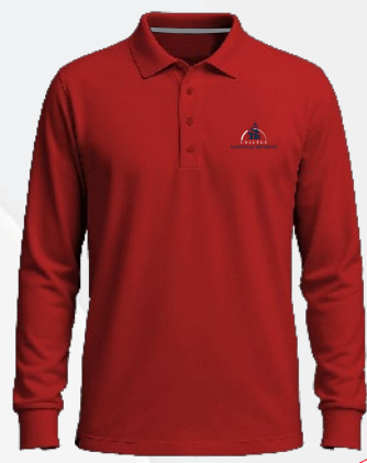
3119 Polo coton extensible