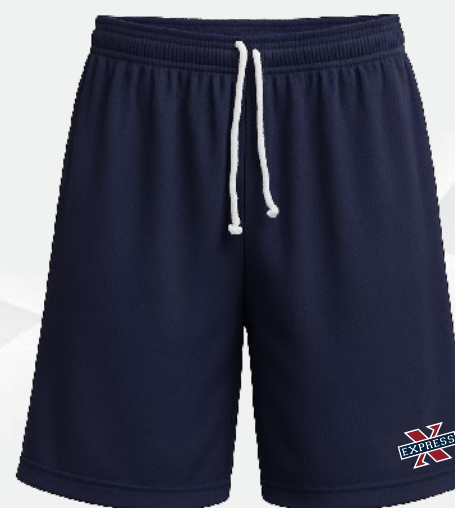
6030 Short long en mesh 25 50 $