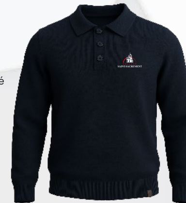
5403Q Pull col polo en tricot