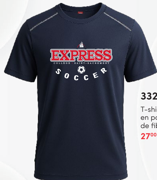
3326 T-shirt raglan en polyester de fibres recyclées 27 00 $

Les prix sont sujets à changement sans préavis