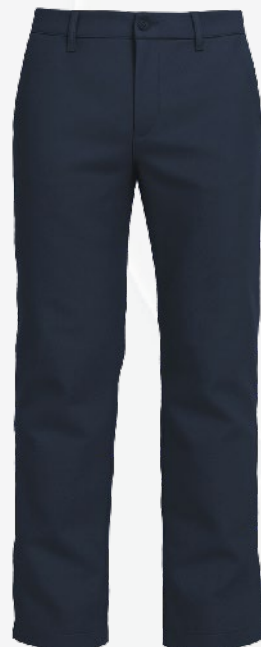
2105 Pantalon taille ajustable tissé