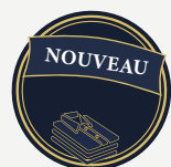
7220 Bas de soccer au genou sublimé SUBLIMÉ 27 00 $ DISPONIBLE SEULEMENT À LA FIN DE L'AUTOMNE