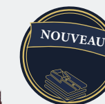
7230 Bas de basketball au mollet sublimé SUBLIMÉ 25 00 $ DISPONIBLE SEULEMENT À LA FIN DE L'AUTOMNE