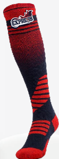
7220 Bas de soccer au genou sublimé SUBLIMÉ 27 00 $