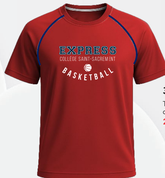
3308 T-shirt raglan en polyester de fibres recyclées 27 50 $