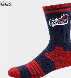
7230 Bas de basketball au mollet sublimé SUBLIMÉ 25 00 $