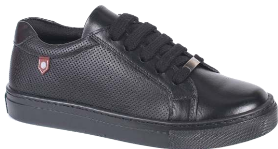
9274 Jane 105 00 $ - 120 00 $