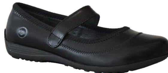
9279 Paloma 89 00 $