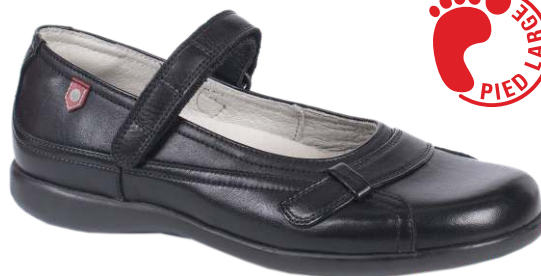
9193 Elena 130 00 $