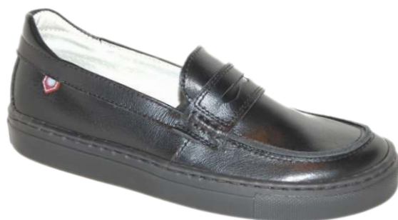
9268 Pawn 120 00 $ - 130 00 $