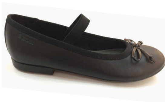
9169 Plie 85 00 $ - 95 00 $