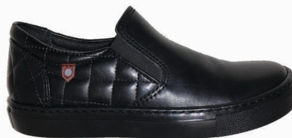
9203 Josia 105 00 $ - 120 00 $