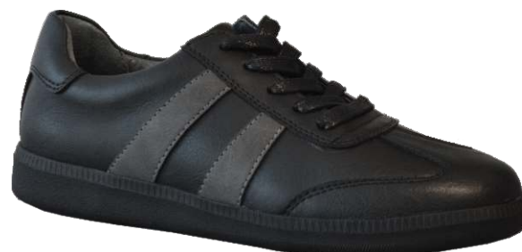
9289 Penny 89 00 $