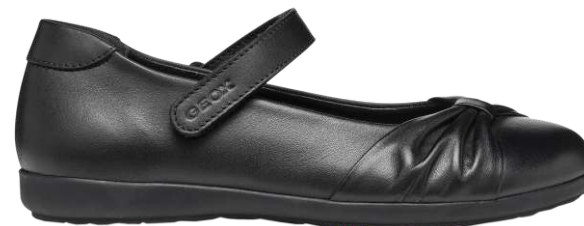
9273 Iberide 95 00 $