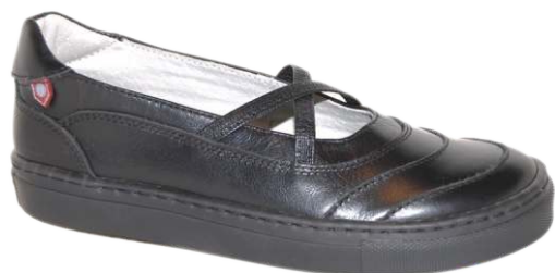
9270 Peanna 120 00 $ - 130 00 $